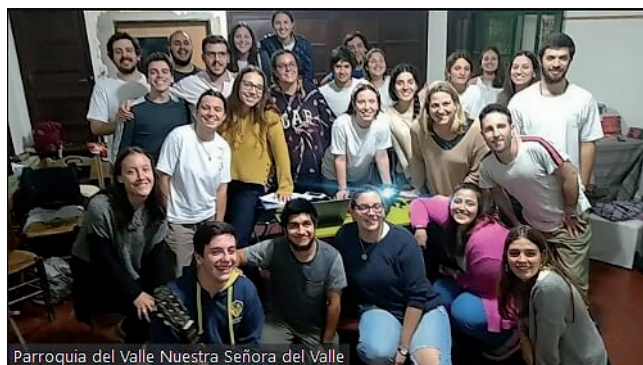
Parroquia del Valle Nuestra Señora del Valle

El retiro fue enmarcado dentro de la segunda semana comenzando con el llamamiento de Cristo Rey, luego meditando las dos banderas, los tres binarios, las bodas de Caná y cerrando por último con la reforma de vida. Las conferencias fueron intercaladas con testimonios acordes a las diferentes vocaciones específicas en la Iglesia. En este sentido queremos agradecer al Padre