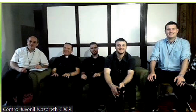
Centro Juvenil Nazareth CPCr